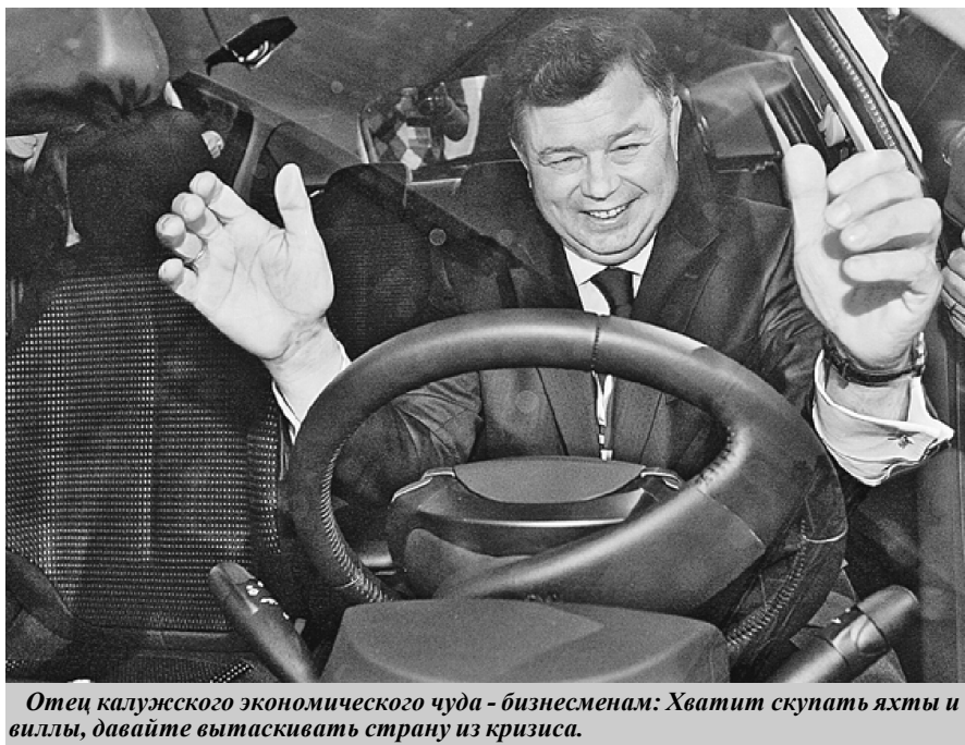
Отец калужского экономического чуда - бизнесменам: Хватит скупать яхты и виллы, давайте вытаскивать страну из кризиса.